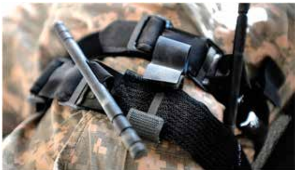
Figura 3: Torniquete Tático.

molinete embutido que permite que seja apertado o suficiente para estancar o sangramento arterial. É importante ressaltar que esse tipo de torniquete pode ser aplicado com apenas uma das mãos, para que o combatente com um braço gravemente ferido possa se tratar no campo de batalha sob fogo, sem ter que esperar por ajuda, que pode demorar o suficiente para que a vítima entre em choque hemorrágico.