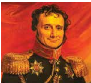
Fonte: Retrato de George Dawe. < https://en.wikipedia.org/wiki/Antoine-Henri_Jomini#/media/File:Antoine-Henri_Jomini.jpg >

ciência militar que lida com a obtenção, manutenção e transporte de material, pessoal e instalações” (BRANDALIZE, 2017).