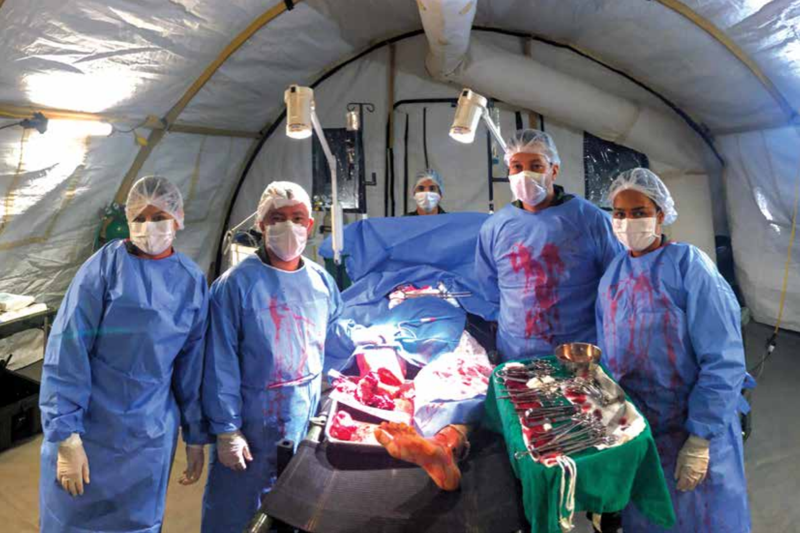
Figura 8: Adestramento da Equipe Cirúrgica da MB na Unidade Avançada de Trauma (UAT) do CFN.