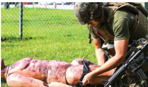
Figura 4: Adestramento com Torniquete Tático.

Os adestramentos focando uso correto do Torniquete Tático (Figura 4) foram disseminados amplamente. Enquanto isso, autoridades militares reuniam informações sobre vítimas, para medir os riscos e benefícios do uso de torniquete. Esses dados foram usados para refinar as práticas de primeiros socorros. As evidências mostraram claramente que a aplicação imediata de torniquetes estava salvando vidas com risco mínimo. Isso dissipou antigas noções de que o uso de torniquetes leva à amputação de membros que poderiam ter sido recuperados. Essas descobertas estimularam ainda mais a pesquisa e o treinamento. Em 2009, os pesquisadores estimaram que o uso de torniquetes no campo de batalha salvou entre 1.000 a 2.000 vidas de militares americanos.