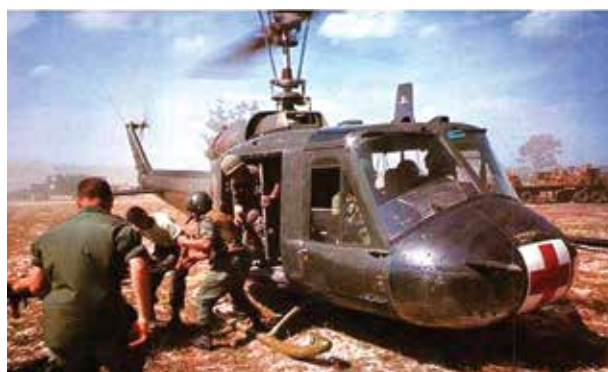
Figura 5: Bell UH-1 "Huey".

O helicóptero Bell UH-1 "Huey" (Figura 5), era grande o suficiente para transportar vários pacientes, além de um paramédico para fornecer cuidados básicos de trauma a caminho do hospital. O heroísmo das equipes de "Dustoff", que frequentemente voavam entre as linhas de tiro, tinham o honroso propósito de resgatar soldados, fuzileiros e aviadores feridos. Foram reconhecidos mundialmente por seus atos de bravura. A atuação das equipes de MEDEVAC tinha como foco, proporcionar o tratamento cirúrgico adequado e rápido. Razão pela qual a mortalidade no campo de batalha no Vietnã, foi muito menor em comparação com as guerras em períodos anteriores.