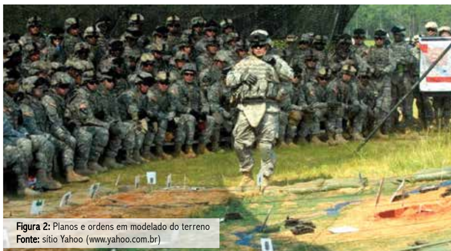
Figura 2: Planos e ordens em modelado do terreno

Da mesma forma, uma gama de conhecimentos de especialização deve continuar a ser transmitida às novas gerações, desde sua fase de formação, de forma a caminharem alinhadas com a filosofia da GM. Entretanto, alguns aspectos de cada especialidade necessitarão de adaptações quanto à forma de emprego de algumas armas, em especial as de apoio de fogo, engenharia, blindados e reconhecimento. Tais mudanças serão fruto de lições aprendidas com a gradual colocação em prática, em nossos adestramentos e exercícios, dos conceitos inerentes à GM. As gerações hoje existentes, as quais não foram educadas por meio desta filosofia, devem ser forçadas ao contato com os novos conceitos ou mudanças surgidas.