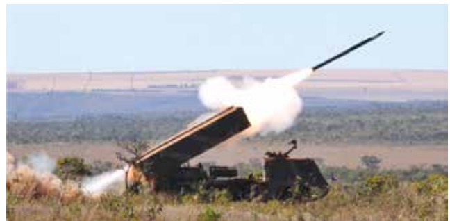
Figura 1: Tiro do ASTROS II em Formosa-GO