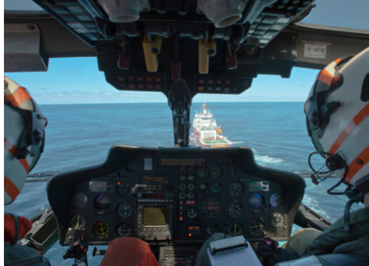
Operações aéreas com UH-17 em Marâmbio durante OPERANTAR

Nessas ocasiões, os Navios Antárticos aproveitam para manter a cultura naval no con-