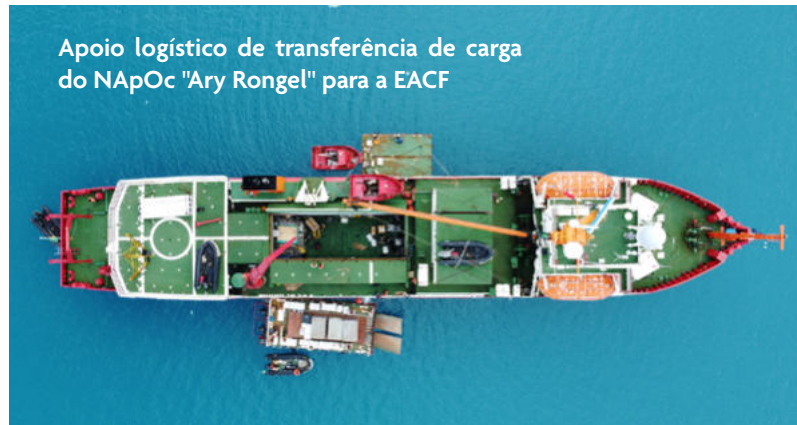
Apoio logístico de transferência de carga do NApOc "Ary Rongel" para a EACF

As atividades na Antártica expandiram-se significativamente ao longo dos quarenta anos. Em média, a OPERANTAR é constituída de quatro pernadas, com duração de trinta a quarenta dias, e permanência ininterrupta na Antártica. São intercaladas por períodos de abastecimento em Punta Arenas, com duração de dois a quatro dias. Durante os seis meses, os Navios permanecem recebendo energia de bordo e precisam manter seus equipamentos operando com eficiência. Desde o Motor de Combustão Principal (MCP) até os equipamentos mais simples, tais como o tratamento de águas servidas, a rede sanitária, a produção de aguada, os equipamentos da cozinha e os aquecedores de água e resistências, precisam operar com confiabilidade, sob o custo de comprometerem as condições operacionais, ambientais e de habitabilidade do Navio.