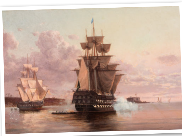
Nau "Pedro I", primeiro capitânia da Esquadra Imperial pintado por Eduardo Martino

D urante muitos anos, disseminou-se no imaginário nacional o mito de que a Independência do Brasil tenha ocorrido de maneira pacífica, sem o derramamento de sangue. A História mostra, entretanto, um contexto diferente: os acontecimentos de 7 de setembro de 1822, na verdade, desencadearam uma sucessão de conflitos entre forças portuguesas e brasileiras que se estende-