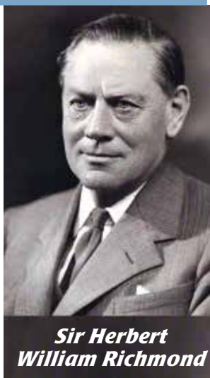
Sir Herbert William Richmond

Dessa forma, a História Naval está inserida na História Marítima. Por sua vez inclui-se também na História Militar, dentro da dimensão História Política. Isso não significa dizer que a História Naval por si só tenha