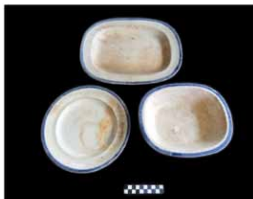
Foto 2 – Faianças inglesas com borda azul: pratos e travessas. Oriundos do Alfama de Lisboa .