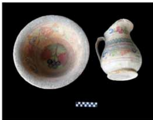
Foto 1 – Faianças portuguesas com motivos florais e policrômico: lava mãos.

Segundo relatos 9 , seu nome Camaquã ou Camacuan , como estava originalmente escrito nas peças (bules, baixelas e talheres de prata),