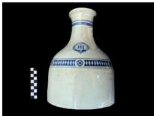
Foto 4 – Faiança com marca da companhia de navegação (Liverpool Brazil and River Plate S. N. C. L.). Oriundo do Copérnicus .