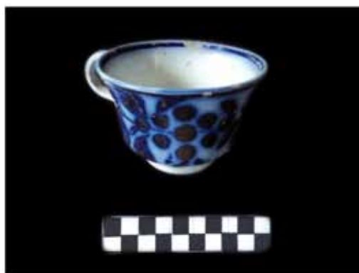
Foto 3 – Faiança inglesa decorada: xícara (padrão decorativo azul borrão, Inglaterra).