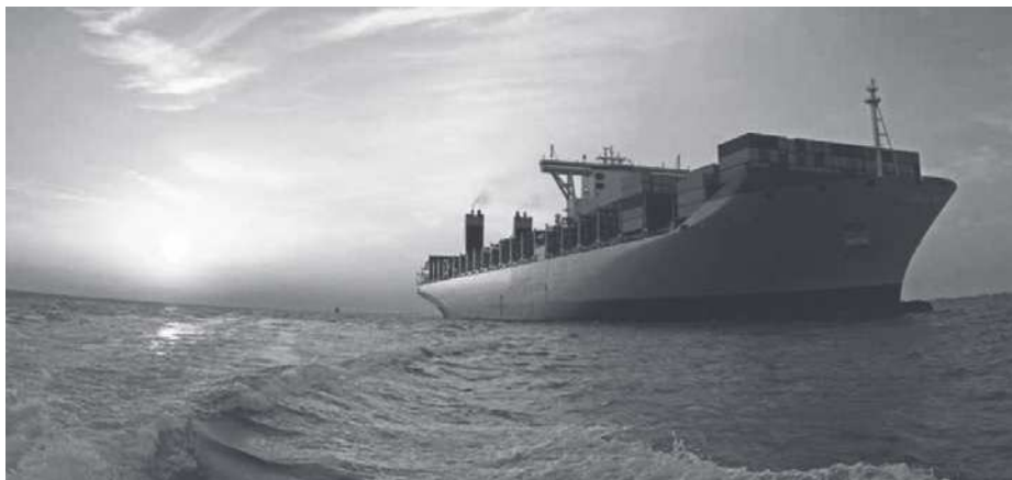
Figura 1 – Transporte marítimo, representado pelo termo shipping

A Organização Marítima Internacional (IMO) 1 é o fórum onde esse processo é realizado, por meio de tratados e convenções, normas criadas por meio da diplomacia e acordos multilaterais. A sua adoção e suas definições são importantes para o tráfego marítimo e contribuem indispensavelmente para a melhoria da eficiência e da segurança do referido modal de transporte.