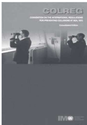
Figura 4 – Capa da Convenção Colreg

resolução trouxe padrões internacionais aos conhecimentos dos marítimos, tais como formação, certificação e serviço de quarto, que se referem à instrução e à qualificação dos navegantes para a função.