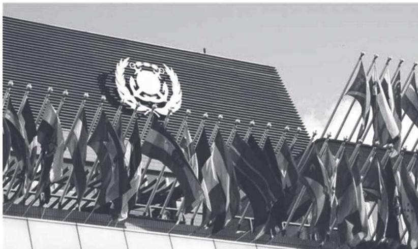
Figura 2 – Fachada da sede da Organização, em Londres

Inicialmente denominada Organização Marítima Intergovernamental Consultiva (Imco), nome que a representou até 1982, tinha o propósito de tratar de assuntos relativos a questões técnicas do transporte marítimo e, posteriormente, à poluição marinha causada pelos navios. Na Conferência Marítima da ONU foi estabelecida a sua Convenção original, que entrou em vigor internacionalmente em 1958 e tem como propósitos instituir a IMO e regulamentar o seu funcionamento, dando início às atividades da Organização.