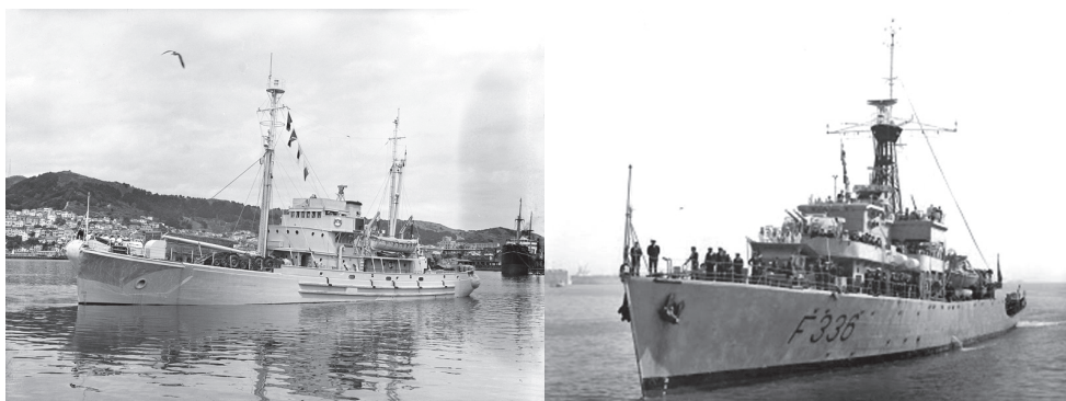
Figura 2 – À esquerda: NRP Pedro Álvares Cabral em 1968, antiga HMS Burghead Bay (imagem disponível em: https://revistadamarinha.com/tag/nrp-almvares-cabral/ ). À direita: RSS John Biscoe em 1956 (fotografia de domínio público tirada pelo The Evening Post , disponível em: http://beta.natlib.govt.nz/records/22780862 )