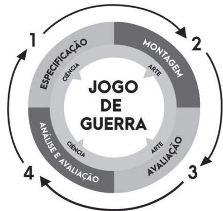
Figura 1 – Jogos de Guerra: ciência e arte 4

A compreensão do que são os JG é extremamente importante para podermos analisar as suas possibilidades, bem como entendermos as suas limitações. Ademais, entenderemos por que os JG são uma mistura de ciência e de arte, em que, a partir da definição de um “problema” ou demanda específica, são identificados os objetivos que balizarão a montagem, a condução e a análise de um determinado jogo.