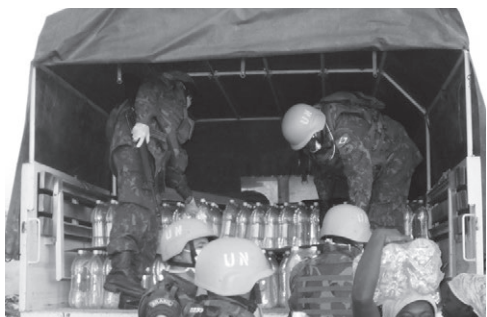
Ações do GptOpFuzNav em resposta ao terremoto

como missões de caráter humanitário e auxílio a desastres. Possui capacidade para carregar e descarregar, pelo mar ou pelo ar, e para operar com embarcações de desembarque em mar aberto, além do horizonte.