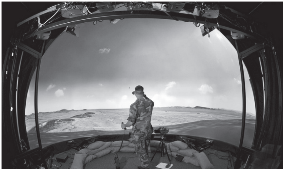
Realidade Aumentada e drones