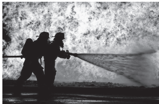
Capacete de bombeiro usando Realidade Aumentada