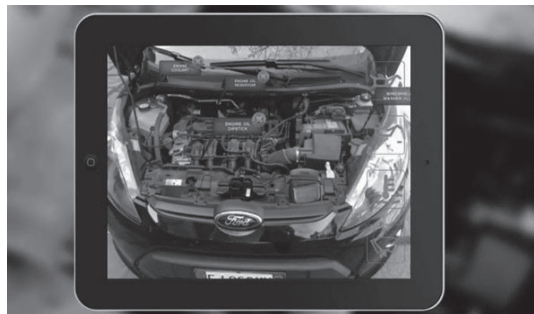
Aplicativo de Realidade Aumentada

Tal recurso consiste no uso de informações em tempo real, na forma de textos, imagens, cores, gráficos, áudio e outros dados virtualmente integrados ao mundo real, ou seja, o usuário estaria enxergando o mundo real, adicionado a vários elementos e diversos dados, de maneira a dar-lhe uma visão mais ampla do que simplesmente o que seus olhos transmitem, potencializando o uso que ele fará da realidade à sua volta. Desta maneira, a Realidade Aumentada demonstra possuir uma infinita gama de possibilidades quanto à sua aplicação. Por exemplo, podemos citar um militar deslocando-se pelo navio e visualizando a temperatura dos motores e se sua manutenção programada está em dia,