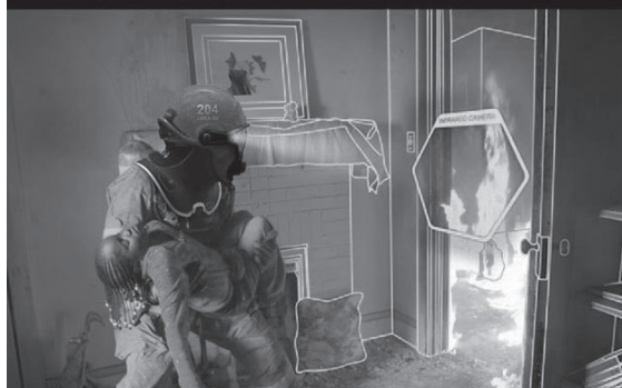
Capacete C-THRU com técnicas de Realidade Aumentada

se existem vazamentos nas redes, informações sobre o funcionamento de diversos equipamentos, entre outros detalhes.