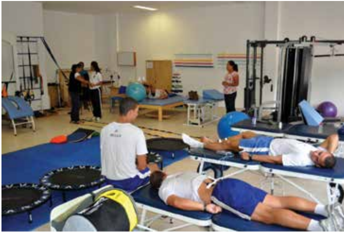
Centro de Reabilitação Físico-Funcional

Destaca-se a tecnologia sustentável e inovadora utilizada na construção dos campos de futebol, com células fotovoltaicas e reutilização da água, dentre outros aspectos. Após os Jogos, as referidas instalações representarão importante legado, não apenas para o esporte nacional de alto rendimento, como também para os projetos sociais e de base desenvolvidos no Cefan.