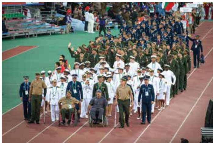
Delegação do Brasil na cerimônia de abertura dos 6 os Jogos Mundiais Militares – Mungyeong, Coreia do Sul, 2015

(84 medalhas no total, sendo 34 de ouro), atrás apenas da Rússia e com intensa participação da MB. Com o resultado, o Brasil consolidou sua posição como potência esportiva militar.