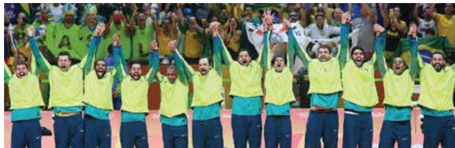
Vôlei (equipe masculina)