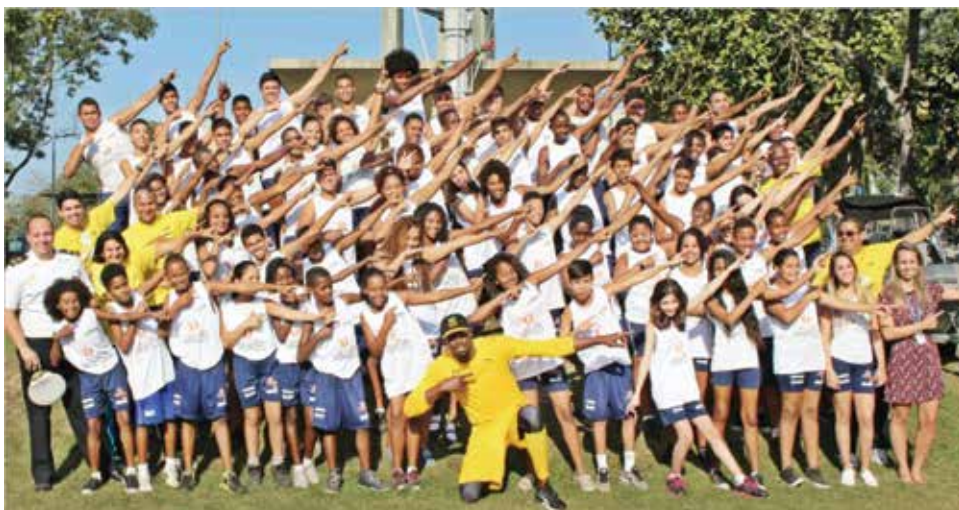
O tricampeão olímpico Usain Bolt (Jamaica) com as crianças do Profesp, no Cefan