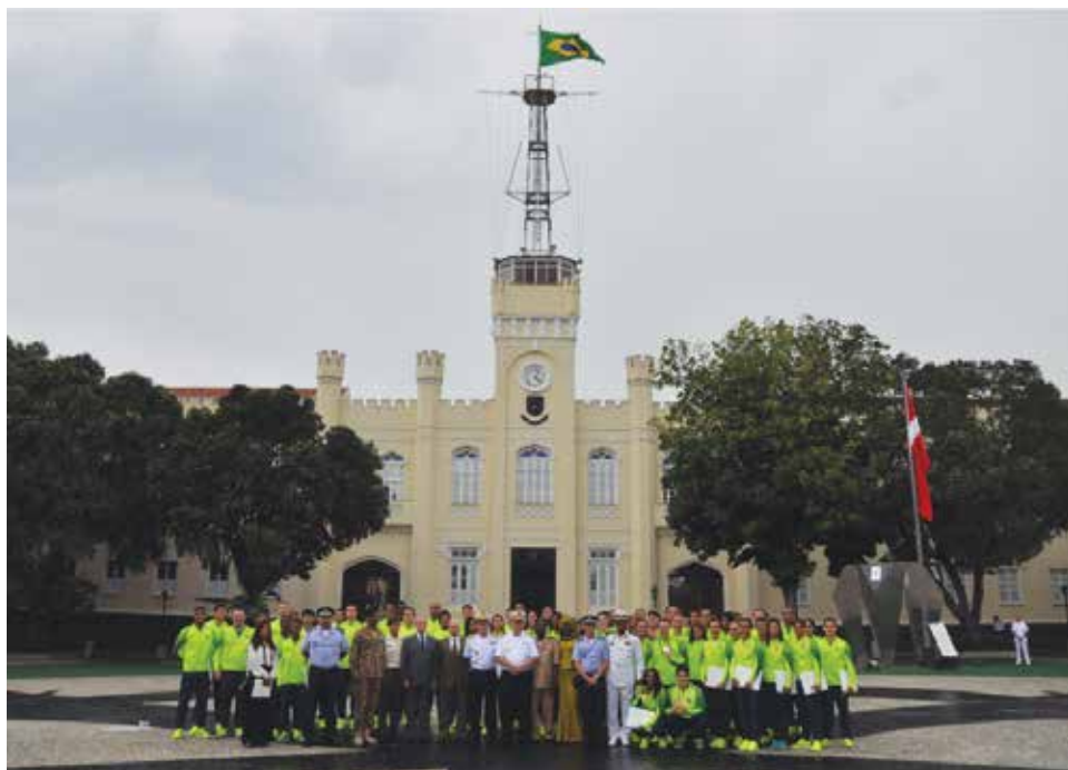
Comandante da Marinha com atletas, em frente ao prédio do Comando-Geral do Corpo de Fuzileiros Navais