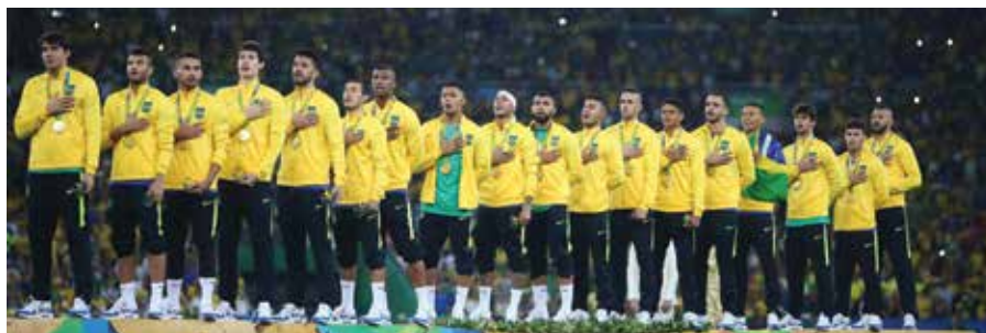
Futebol (equipe masculina)