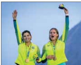
Medalhistas de ouro da Marinha