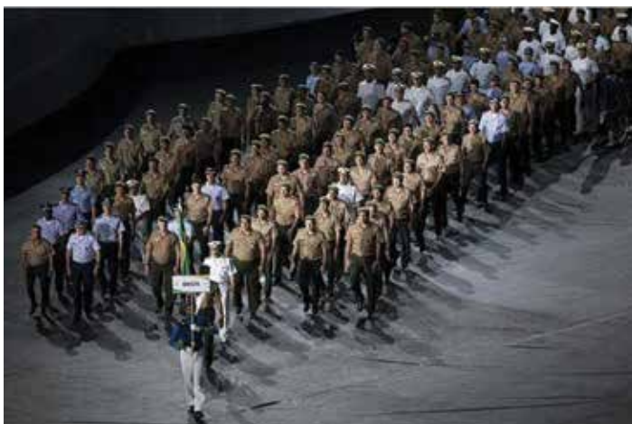
Equipe do Brasil na abertura dos V JMM - Rio 2011

e elevar o nível da participação brasileira nos Jogos Mundiais Militares, cuja quinta edição seria realizada em 2011 no Brasil, por meio da incorporação à Marinha de atletas de alto rendimento. A iniciativa da Marinha foi, logo em seguida, reproduzida pelo Exército Brasileiro e, alguns anos mais tarde, pela Força Aérea. O objetivo do Paar consistia exatamente