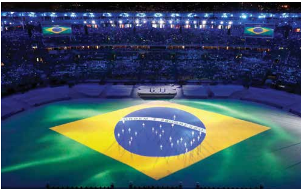
Festa de encerramento das Olimpíadas no Maracanã