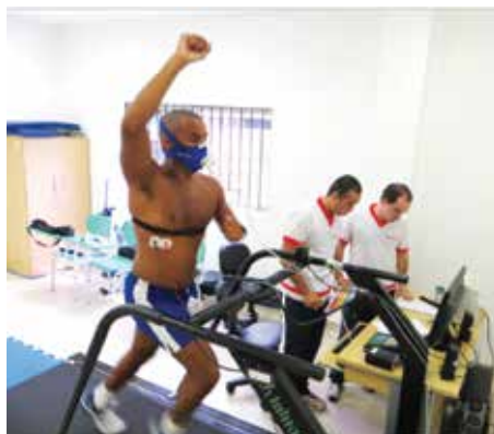
Laboratório de Pesquisa em Ciências do Exercício (Laboce)

O Cefan busca novas parcerias que permitam a manutenção ou ampliação deste projeto tão bem-sucedido