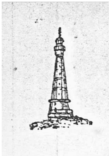
Lista de Faróis 1930

do rio Preguiças” e inaugurado em 16 de julho de 1909 em forma de “torre metálica sobre esteios de rosca Mitchell, tendo próxima a casa dos pharoleiros, tudo pintado de branco”.