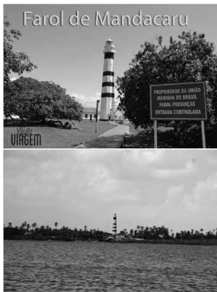
Farol Preguiças ou de Mandacaru