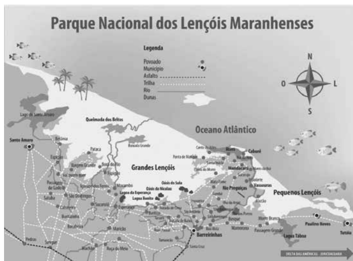
Parque Nacional dos Lençóis Maranhenses

tensão de dunas costeiras do Brasil, onde está a grande estrela do turismo maranhense, o Parque Nacional dos Lençóis Maranhenses, ou os Grandes Lençóis, à esquerda do Rio Preguiças. À direita do referido rio, seguem os chamados Pequenos Lençóis, numa paisagem semelhante à dos Grandes Lençóis, e que se estendem até Tutoia, onde começa o Delta do Parnaíba. 6