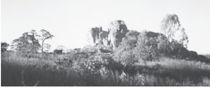
Pedra do Alemão, nas proximidades do local onde ocorreu a emboscada do dia 19 de maio de 1997

Vila Nova, Huambo, Lobito, Benguela e Luanda, e era reconhecidamente violenta. Ou seja, todos os comboios da ONU ou do Brabatt que transitavam de Kuito para Huambo, Lobito, Benguela e Luanda, e vice-versa, obrigatoriamente, teriam que passar pelo local. Naquela região, entre Vila Nova e Huambo, passou atuar a nova 3ª Companhia de Força de Paz.