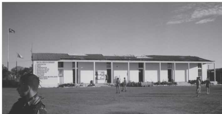
Aquartelamento da 3ª Companhia de Fuzileiros de Força de Paz, em Vila Nova, de onde partiu a patrulha do Cb Aladarque, no dia 19 de maio de 1997

Após a repatriação do Batalhão do Uruguai (Urubbatt), a região de Vila Nova,