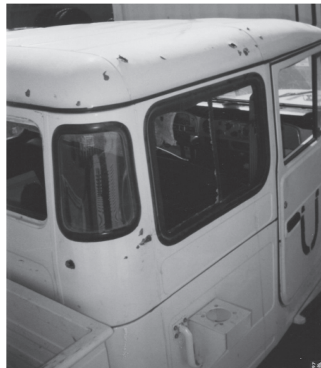
Detalhe da lateral direita da Viatura Toyota Bandeirante UN 8369. Observe-se que os vidros direito e da retaguarda da cabine estão quebrados

A viatura Toyota UN 8369 havia sido transfixada por pelo menos uma dezena de