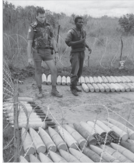
Área de destruição da Escola de Desminagem Francesa, nas proximidades de Kuito

Os militares que participaram daquela missão sabem que muitos fatores influíam negativamente sobre o estado moral e o estado disciplinar da tropa, tais como: o grande número de militares infectados pela malária, exposição a diversas doenças, a ação esporádica de agressores armados, a dificuldade de comunicações com o Brasil, a saudade da família, os exames semanais de malária (lâmina), os comprimidos semanais de mefloquina 4 , a grande quantidade de campos minados (uma das viaturas do Exército Brasileiro já havia explodido na região de Kamakupa, durante