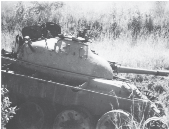
Carro de combate destruído nas proximidades de HUAMBO

o 3º Contingente), a tensão gerada por se estar entre duas forças beligerantes, e a total abstinência sexual, dentre outros.