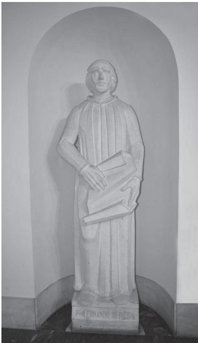
Estátua do Padre Fernando Oliveira, localizada no Estado-Maior da Armada, em Lisboa

da tática naval. A tabela 2 lista todos os capítulos do livro.