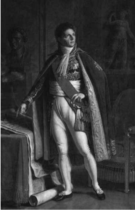
Louis Alexandre Berthier, Prince de Neufchâtel et de Wagram, Maréchal de France (1753-1815)

Entretanto, nem todos tiveram pleno êxito em suas carreiras. Alguns desses militares fracassaram em momentos-chave. Um deles foi Grouchy, que não conseguiu perseguir o exército prussiano de Gebhard von Blucher, permitindo que as tropas prussianas se juntassem aos ingleses em Waterloo. Outro, o grande Marechal Michel Ney, lançou uma desastrosa carga de cavalaria contra os ingleses na mesma batalha.