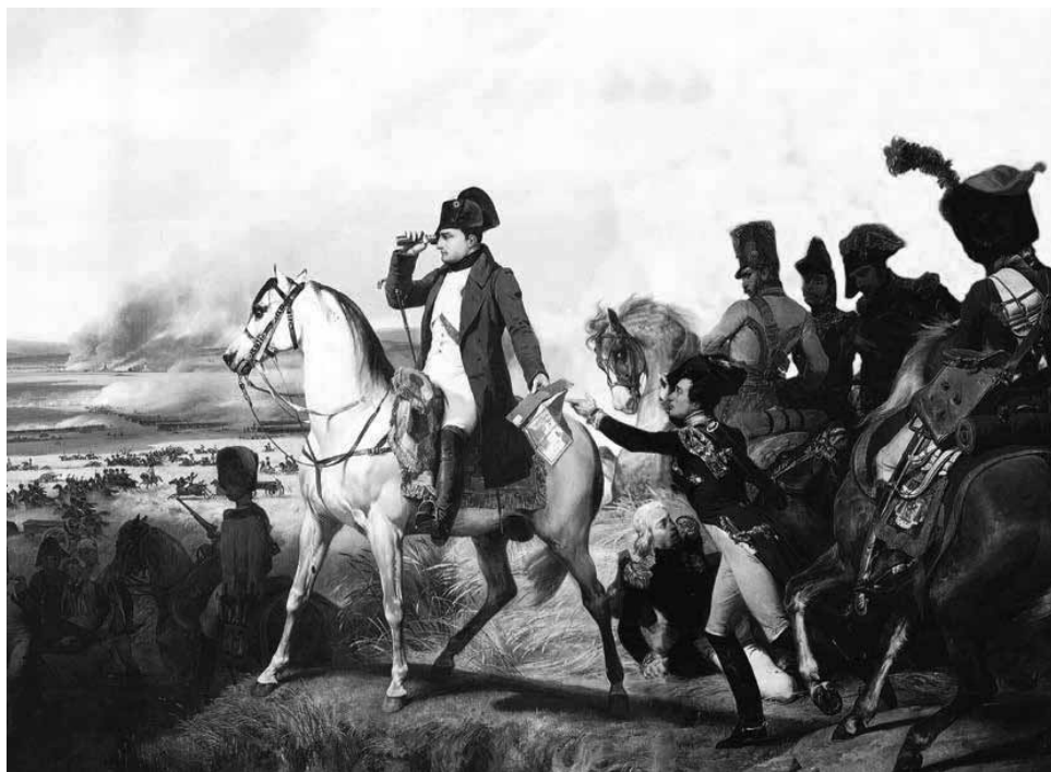
Napoleão em campo de batalha

A Revolução Francesa permitiu que muitos militares pudessem demonstrar seu valor por dois motivos: o primeiro porque não era mais necessário ser nobre para galgar altas posições no Exército, e o segundo porque não faltavam guerras para a França lutar, devido à invasão do seu território por outras nações europeias, que tinham medo de a revolução se espalhar para todo o continente.