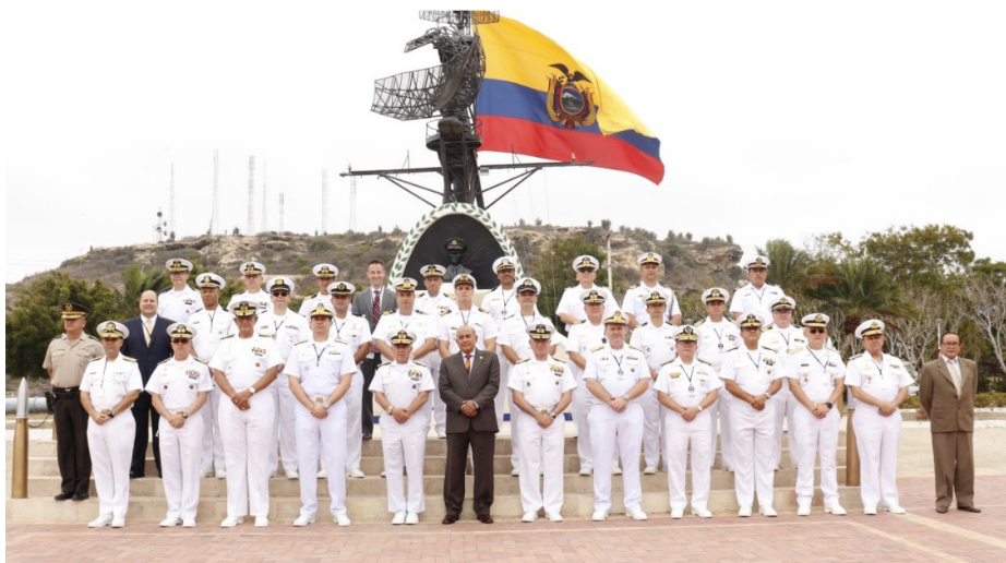
Figura 4 – Foto oficial da VIII CNIE-C,T&I 2021, com os representantes dos países participantes (BRASIL, 2021)

aéreas e navais não tripuladas; normas para a regulamentação do uso militar e civil de drones; uso do sistema antidrone e desenvolvimento de veículos aéreos não tripulados equipados com tecnologia capaz de caracterizar o litoral em áreas estratégicas de interesse; e estabelecimento de um centro de comando e controle para tomada de decisões em eventos oceânicos severos, como tsunamis e outros fenômenos naturais, como El Niño e La Niña. A conferência também apresentou temas relevantes concernentes à aplicação da CT&I em benefício da indústria de defesa no setor de construção, reparação e modernização de unidades navais; à interoperabilidade entre os sistemas de monitoramento dos espaços marítimos interamericanos e cooperação regional no campo das ações de segurança marítima; à contribuição da CT&I para a chamada “Economia Azul”; e à importância da atividade em prol das ciências do mar, pesquisa operacional, análise de sistemas, engenharia, tecnologia, modelagem, simulação e capacidades multinacionais