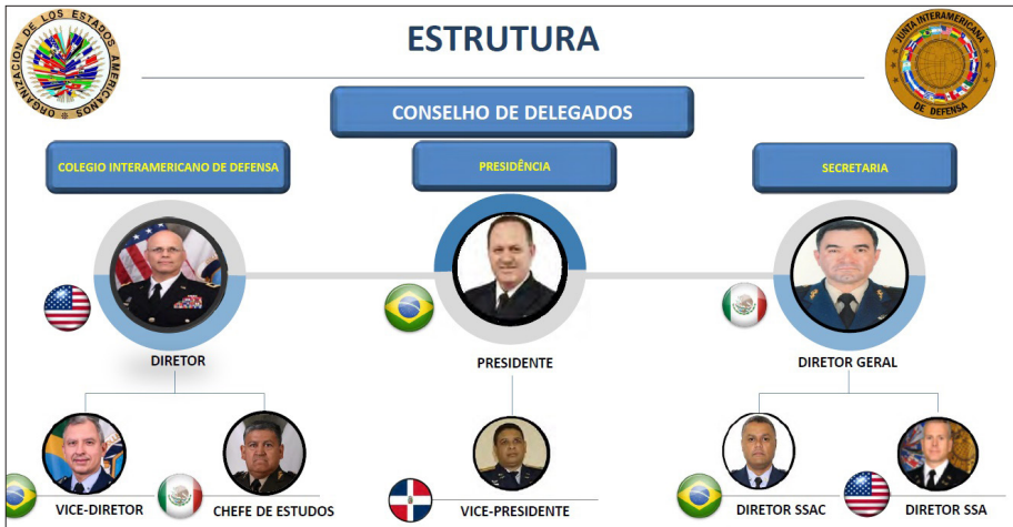
Figura 2(b) – Estrutura Organizacional da JID em 2021 (DE FARIA, 2021)

papel que a JID vem desempenhando ao longo dos anos no apoio ao desenvolvimento das conferências, nos vários serviços prestados, nos painéis e grupos de trabalho, bem como no desenvolvimento dos mesmos (DE FARIA, 2021).