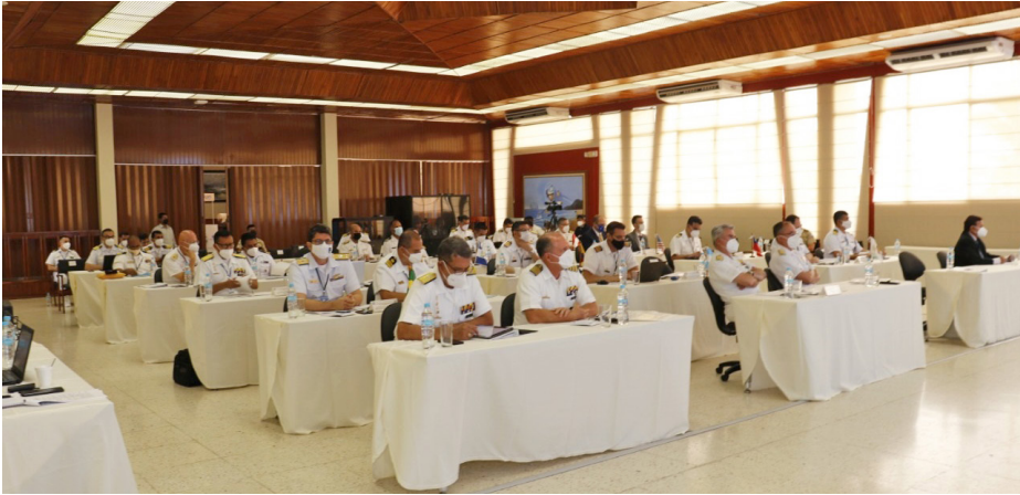
Figura 5 – Tratativas entre as comitivas durante o evento

do tema aos países e a necessidade constante de desenvolvimento de mecanismos de cooperação regionais e sub-regionais;