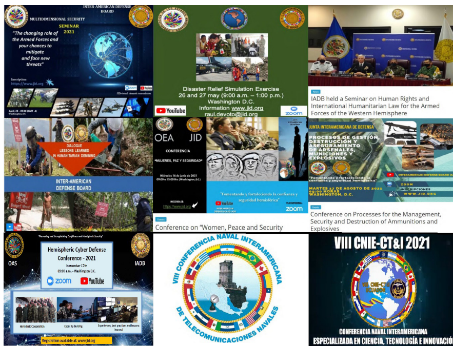
Figura 3 – Exemplos de conferências organizadas pela JID e que possuem vinculação com a OEA (DE FARIA, 2021)

da OEA/JID. Neste fórum, são definidas as realizações das Conferências Navais Interamericanas Especializadas (CNIE) em diversas áreas de interesse naval, como a Conferência Naval Interamericana Especializada em Telecomunicações e Informática (CNIE-CT&I), a Conferência Naval Interamericana Especializada em Operações de Helicópteros Embarcados em Unidades de Superfície (CNIE-Hostac), a Conferência Naval Interamericana Especializada em Controle Naval do Tráfego Marítimo (CNIE-CNTM), a Conferência Naval Interamericana Especializada em Interoperabilidade (CNIE-I) e a Conferência Naval Interamericana especializada em Ciência, Tecnologia e Inovação (CNIE-CT&I), foco deste artigo e cuja última edição será descrita no próximo tópico, entre outras, conforme ilustra a Figura 3.