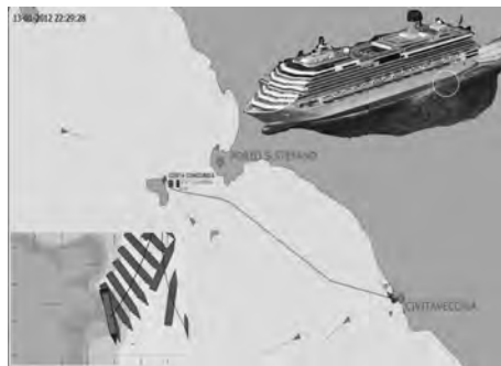
Figura 1 – Esquema da situação