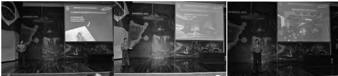
Figura 5 – Fotos do Seminário Caso Costa Concordia apresentado pelos aspirantes Barbosa Silva, Frota e Amaral no Auditório Greenhalgh, Escola Naval

peso a bordo e economia de combustível, dispensa de uso de engrenagens redutoras, eixos propulsores, motores de combustão principais, máquina do leme, mancais de escora etc., substituiu o leme convencional e confere excepcional manobrabilidade ao navio mesmo em situações de emergência (figura 4).