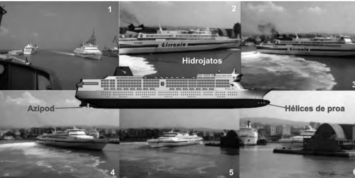
Figura 8 – Tomadas em sequência de vídeo filmado a bordo do Navio-Escola Brasil no porto de Civitavecchia (XVI VIGM) (Vídeo disponível em http://youtu.be/UVC9ozL0a1E )

Quanto à propulsão azipod , suas vantagens são muito superiores à propulsão convencional, a qual, em face da gravidade da colisão, também seria gravemente comprometida. As seqüências de vídeo capturadas da figura 8 demonstram a alta capacidade de manobra de embarcações equipadas com a propulsão a hidrojato, ideal para uso em águas rasas. Da mesma forma, a propulsão azipod , combinada com hélices de proa, possui a mesma capacidade e é empregada em áreas mais profundas, permitindo que seja dispensado o auxílio de rebocadores na atracação e na desatracação do navio (detalhe central da figura 8).