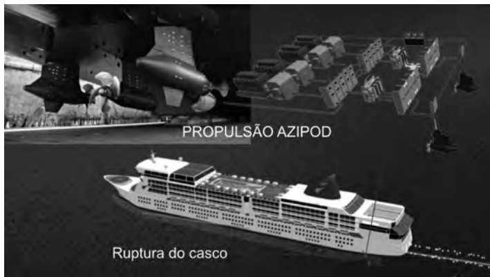
Figura 4 – Esquema da avaria no sistema de propulsão azipod e no sistema de geração de energia a bordo

Neste ponto, cabe destacar que, se o navio tivesse soçobrado 5 em águas profundas e a situação fosse agravada por uma