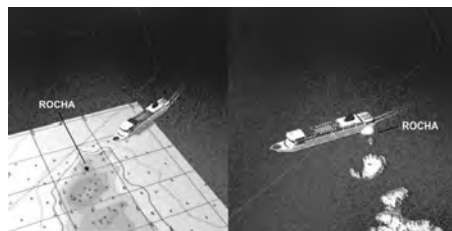
Figura 3 – Trecho da animação elaborada na EN, que reconstitui por meio de um modelo 3D de um navio de passageiros genérico, a cinemática do acidente, com base nos dados fornecidos pelo AIS (Automatic Identification System). (Vídeo disponível em http://youtu.be/j6HeYQXJHWo )