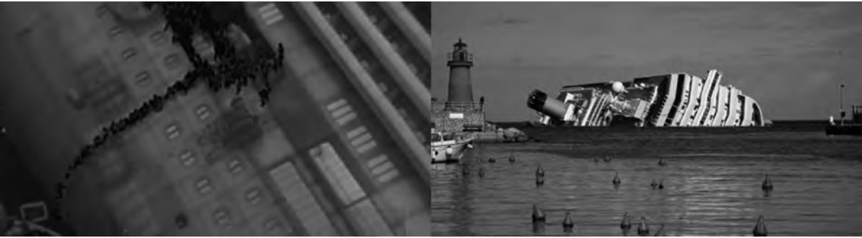
Figura 6 – Fase final do abandono noturno e situação final do navio encalhado (Fontes: Guarda Costeira Italiana e Portal Naval)

tos, visto que as portas estanques possuíam travas elétricas automáticas acionadas por sensores de alagamento, mas que não funcionaram após o “apagão” do navio.